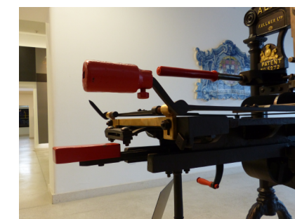
PRENSA . NAVE 2