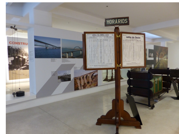
PORTA-HORÁRIOS . NAVE 2

Algumas peças expostas apresentam componentes salientes.