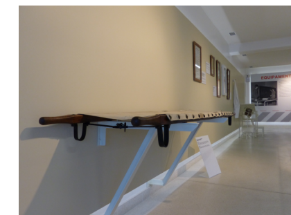
MACA . NAVE 4