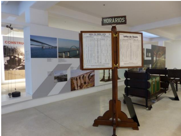
PANNEAU HORAIRES . SALLE 2