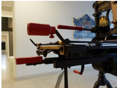
PRESSE . SALLE 2