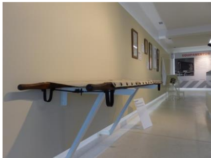
CIVIÈRE . SALLE 4