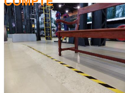
6 DÉNIVELÉS AU SOL Dans certaines zones des salles d'exposition, il y a des dénivelés au sol, dûment signalés.