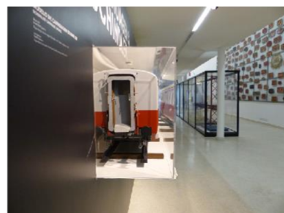
3 OBJETS SAILLANTS À l'étage 0 de la salle 13, attention aux coins saillants créés par la maquette de voiture Schindler.