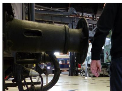
5 PARE-CHOC Lorsque vous contournez les locomotives, attention aux pare-chocs qui dépassent de leurs extrémités