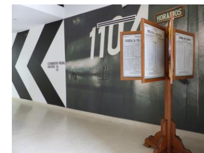
1 PANNEAU HORAIRES . ENTRÉE

Certaines pièces exposées présentent des éléments saillants.