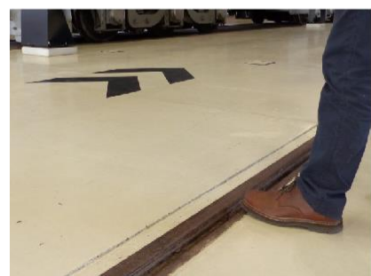
4 RAILS SUR LE SOL Attention à la présence de rails encastrés dans le sol.